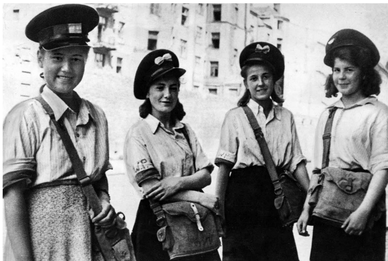
Załącznik numer 2 - harcerki poczty polowej

http://www.polskieradio.pl/5/3/Artykul/413660,Czwarty-dzien-walk-Harcerska-Poczta-Polowa