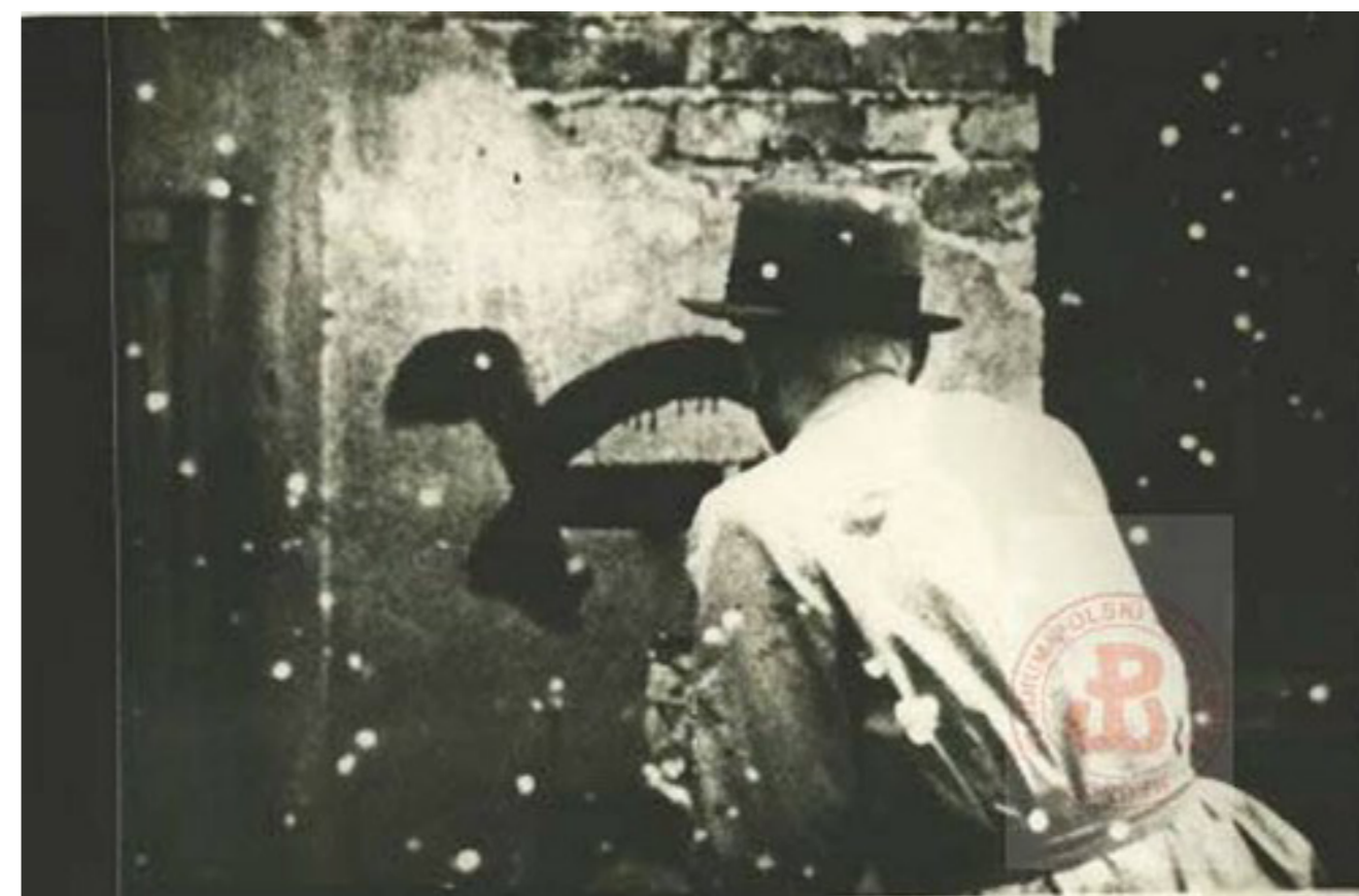
Załącznik numer 3 - napisy na murach: żółw i Polska Walcząca

„W najbliższych godzinach gestapo miało aresztować upatrzonych przez siebie Polaków. Na szczęście udało się zdobyć odpis listy tych osób wraz z ich adresami. Los tych ludzi zależał od zawiszaków i od ich pośpiechu. Trzeba było zagrożone aresztowaniem osoby natychmiast ostrzec przed niebezpieczeństwem. Zawiszacy musieli za wszelką cenę wygrać wyścig z gestapo i nie zwracając na siebie uwagi Niemców, dotrzeć do lokali. Rozbiegli się, aby odszukać domy, w których mieszkali zagrożeni aresztowaniem Polacy. Rzecz jasna, podczas wykonywania tego zadania towarzyszył im strach (czy gestapo nie wpadnie w tej samej chwili pod wskazany adres), musieli przełamywać swoją nieśmiałość (trzeba było przecież zapukać do obcego mieszkania). Jednak zdążyli dotrzeć pod wszystkie otrzymane adresy - dziesięć osób uchronili przed represjami okupanta.”